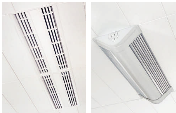
Links boven: Plafond inbouw