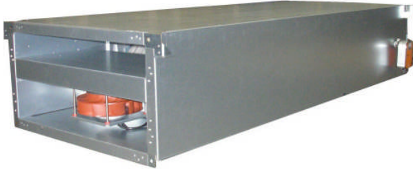
LTG gevelventilatie unit Univent ® type FVS