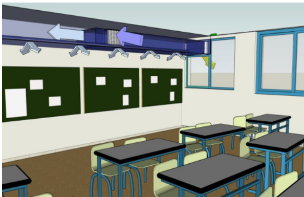
LTG gevelventilatie unit Univent ® type FVS - Inbouw voorbeeld in plafond